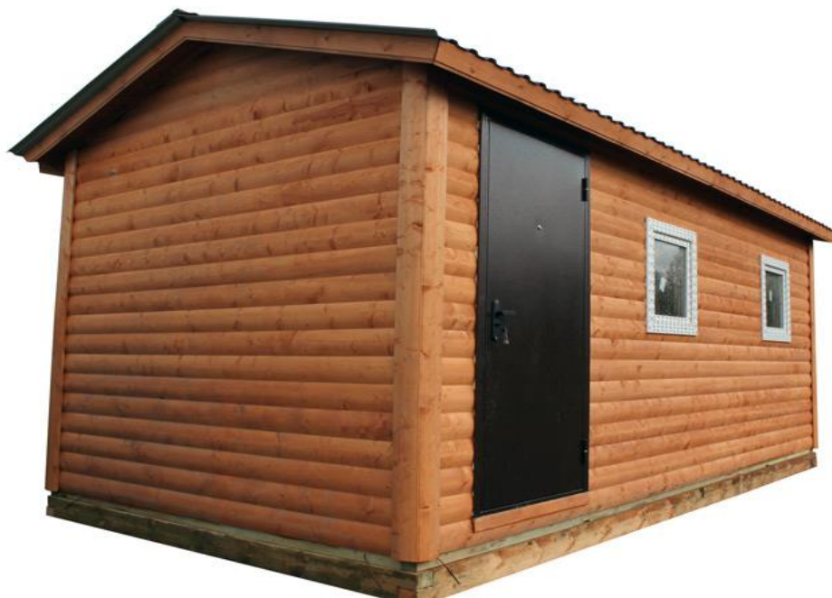
Стоимость садового домика «Онежский»

Садовый домик «Онежский» – это быстрый и недорогой способ обзавестись жилищем на своём дачном участке. Готовность домика на производстве – от одной недели! При этом, ваш участок не превращается в стройплощадку – монтаж домика на фундамент занимает несколько часов! «Онежский» – это тёплый, надёжный и красивый садовый домик на долгие годы!